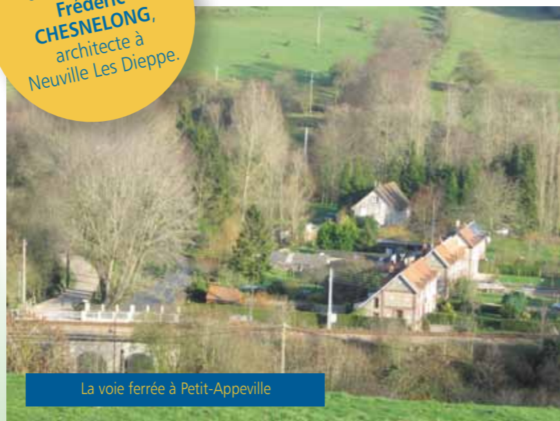
La voie ferrée à Petit-Apperville