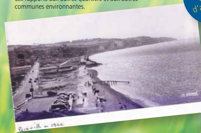
Pourville - 1966