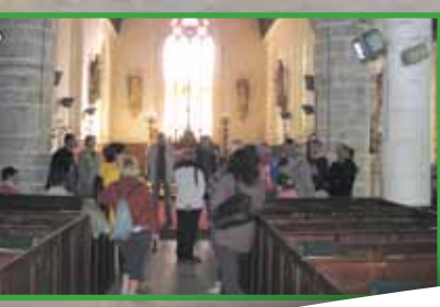
Les Journées Européennes du patrimoine