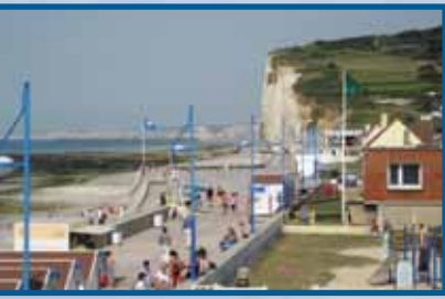
Pavillon bleu 2011