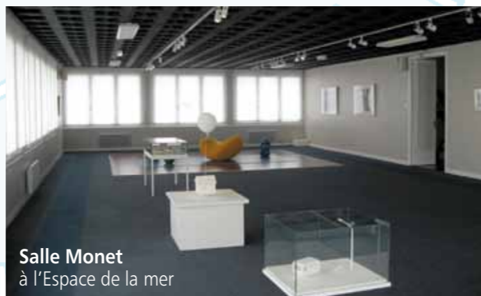
Salle Monet à l'Espace de la mer

L'exposition présentait un regard critique sur la vie moderne et son conditionnement par l'habitat, l'urbanisme, et la manière dont cela influence la vie sociale.