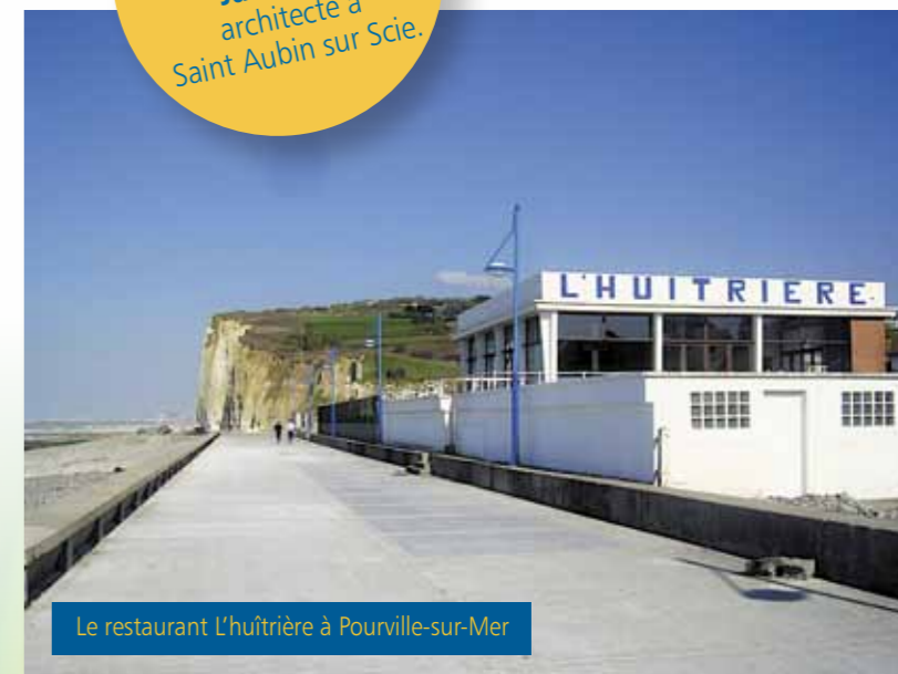
Le restaurant L'huître à Pourville-sur-Mer