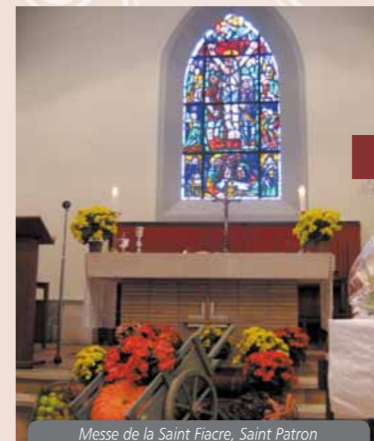
Messe de la Saint Fiacre, Saint Patron des Maraîchers

- décoration unique de l'église à l'occasion de la Saint Fiacre (messe à 9h30) patron des jardiniers.