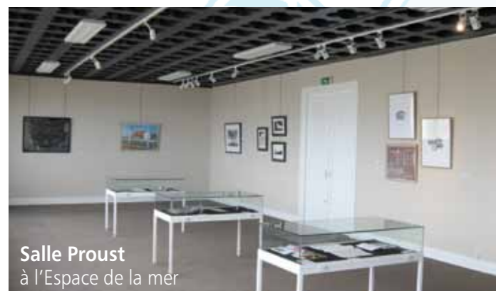
Salle Proust à l'Espace de la mer

L'exposition « La Vie Moderne » à l'Espace de la Mer