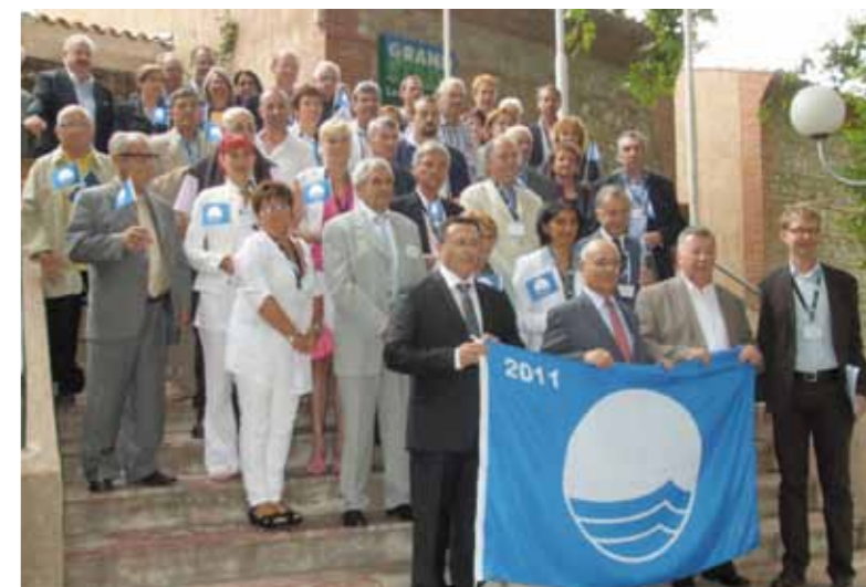
Le 27 mai dernier s'est déroulée la conférence de presse d'annonce du palmarès pour les communes labellisées Pavillon Bleu 2011. C'est sur la commune de Saint Cyprien (Pyrénées Orientales) que les communes lauréates ont été accueillies pour fêter leur labellisation.

Des actions sont donc menées en vue de respecter les critères impératifs du Pavillon Bleu. Outre les critères de qualité des eaux de baignade, la commune a fait installer des conteneurs pour le tri sélectif à proximité de la plage. Un panneau d'informations est installé à chaque ouverture de saison sur la promenade au niveau du poste de secours où sont affichés les critères, la qualité des eaux de baignade, le plan de la plage, les activités environnementales. Un panneau d'informations Faune et Flore de la ZNIEFF (Zone Naturelle d'Intérêt Ecologique Floristique et Faunistique) vient d'être installé sur la sente le long de la Scie à proximité de la Boulangerie Beaufils.