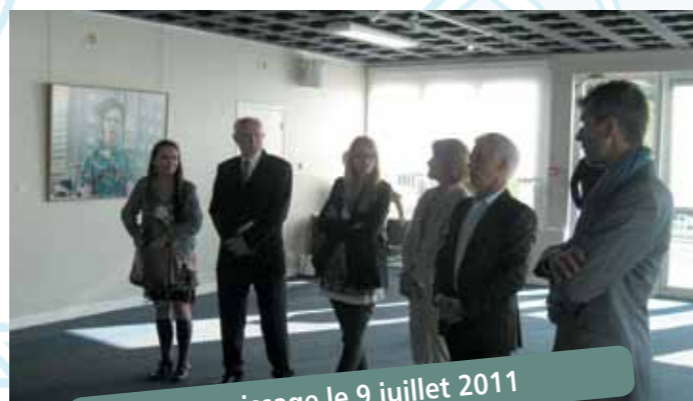
Vernissage le 9 juillet 2011

L'exposition « La Vie Moderne » à l'Espace de la Mer