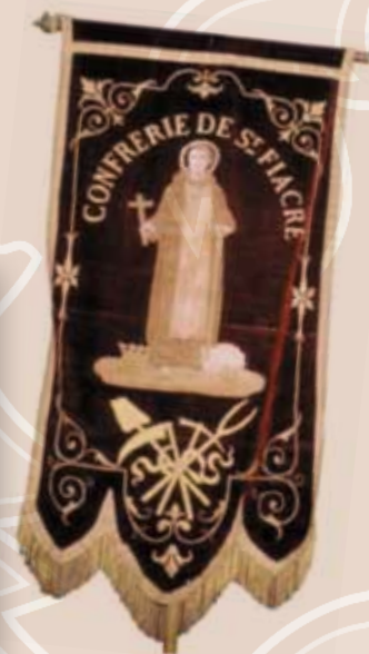
Bannière de la confrérie

Chaque fois l'église s'avère trop petite ! Les légumes sont offerts aux nécessiteux et la journée se termine par un banquet.