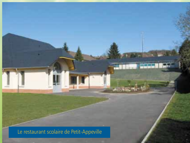
Le restaurant scolaire de Petit-Apperville