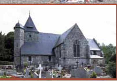
Les églises de nos villages se racontent