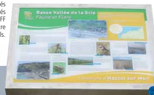
Panneau d'informations Faune et Flore de la ZNIEFF (Zone Naturelle d'Intérêt Ecologique Floristique et Faunistique)