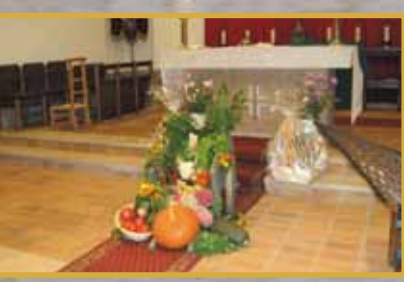
Messe de la Saint Fiacre